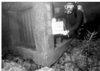
▲バフンウニ調査 昭和55年7月22日 69793